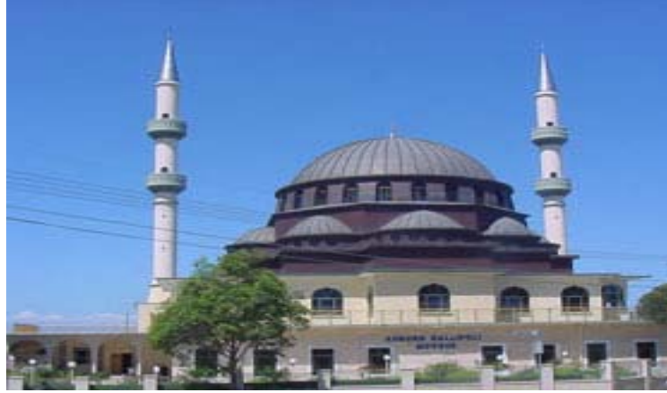
مسجد الاتراك فى ضاحية اوبرن (ولاية نيوساوث ويلز)

ويقدر عدد المساجد المنتشرة بحوالى 221 مسجداً وتنتشر معظمها فى الولايات الثلاثة الكبرى مثل ولاية نيوساوث ويلز - ولاية فيكتوريا - ولاية كوينزلاند.