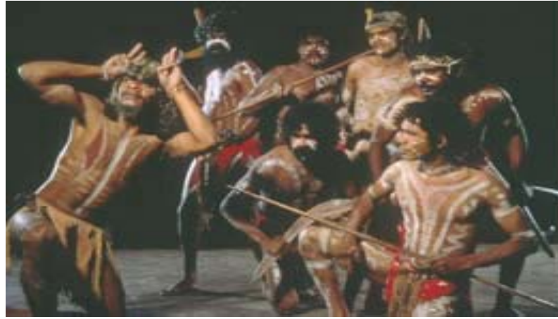
السكان الاصليين (ابروجينال)

اول من اكتشف آستراليا كابتن / كوك فى رحلته البحرية فى عام 1770 م , وبعد مرور 18 عام حضر الكابتن /فليب ارثر من البحرية الملكية البريطانية وبرفقتة احد عشر اسطولاً بحرياً محملاً سجناء من المنفيين ورسى فى مينا(بوت جاكسون) واستقر بهم المقام فى هذه المنطقة التى عرفت فيما بعد بمدينة (سيدنى).